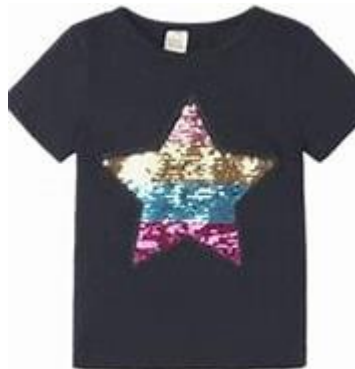
スパンコールやビーズが たくさん付いている服