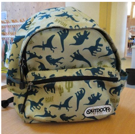
リュックまたは手提げかばん