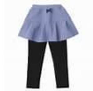
スカッツ (スカートとズボンがくっついているもの)