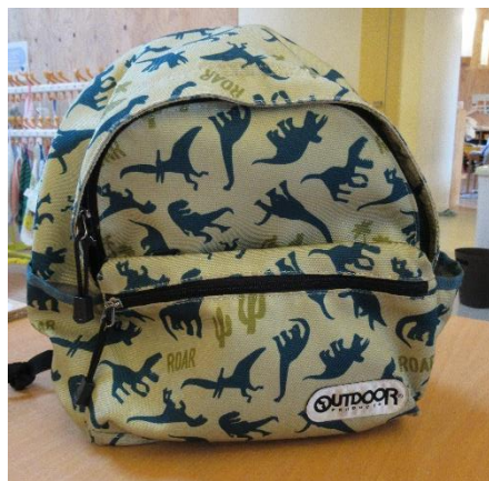
リュックまたは手提げかばん